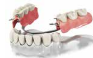
Рехабилитация чрез използване на зъбни протези

Рехабилитацията при няколко липсващи зъба чрез използване на няколко импланта и постоянни корони ще елиминира необходимостта от зъбни протези, които предизвикват дискомфорт, загуба на кост и понижават качеството на живот.