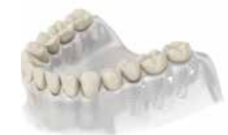
Пълна устна рехабилитация