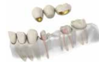
Рехабилитация с поставяне на мост

В този случай единичен имплант с корона е идеалното решение. Конструкцията на изкуствения зъб върху импланта представлява естетично и удобно решение, което предотвратява необходимостта от изпиляване и/или лечение на каналите на корените на съседни зъби.