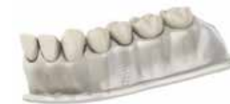
Рехабилитация с поставяне на имплант