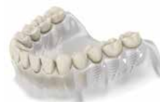
Рехабилитация чрез използване на няколко импланта