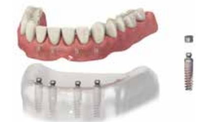
Импланти за стабилизиране на зъбни протези

Имплантите допринасят за стабилността и закрепването на зъбните протези. Зъбни протези без импланти не са най-добрият заместител на липсващи зъби, защото това решение може да доведе до резорбция (стопяване) на костта, нестабилност, гингивит, намалена дъвкателна способност и общ дискомфорт. Поставянето на импланти за закрепване на зъбни протези допринася за подобряването на всички тези параметри.